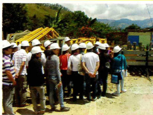
Estudiantes de la Universidad Cooperativa visitaron las obras del proyecto vial "Girardot – Ibagué - Cajamarca".