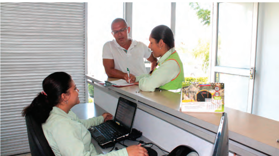
► Los peticionarios reciben atención personalizada por profesionales de la Concesionaria.

Con el ánimo de mantener y fortalecer el sistema de atención a la comunidad y usuarios del corredor vial Girardot - Ibagué - Cajamarca, Concesionaria San Rafael, cuenta adicionalmente con un Punto Fijo de Atención, ubicado en el kilómetro 9 vía Ibagué - El Espinal, 500 metros antes del peaje del Alto de Gualanday.