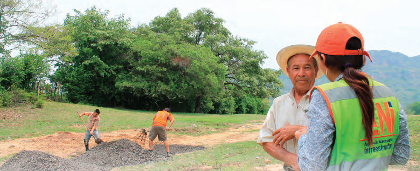
▲ Conformación del material en el carreteable de la Vereda Buenos Aires, de Ibagué.