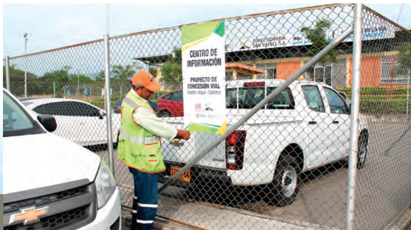
► Los avisos se encuentran instalados en lugares visibles, para los usuarios que transitan la vía.

En aras de continuar consolidando la imagen institucional, se renovaron los avisos del Área de Servicios y Punto de Atención Fija de Concesionaria San Rafael S.A., para ofrecer a los usuarios del corredor vial y vecinos del Proyecto, un espacio de acercamiento, en el que tramitan solicitudes y resuelvan sus inquietudes.