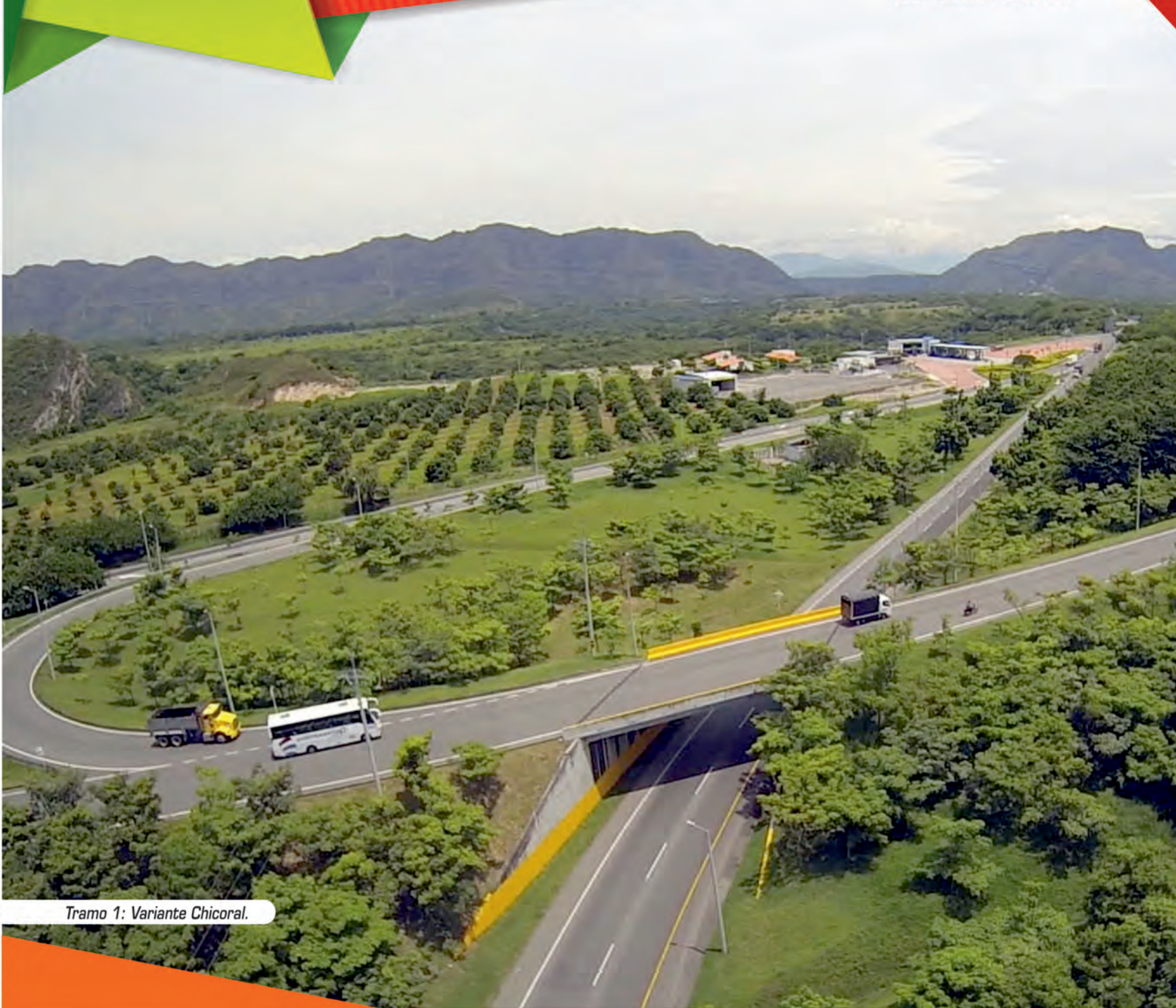
Tramo 1: Variante Chicoral.