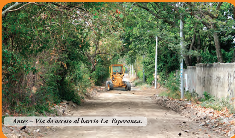
Antes – Vía de acceso al barrio La Esperanza.