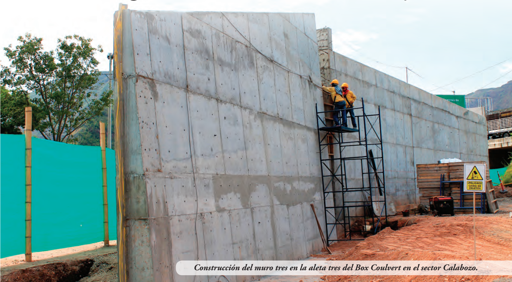
Construcción del muro tres en la aleta tres del Box Couvert en el sector Calabozo.