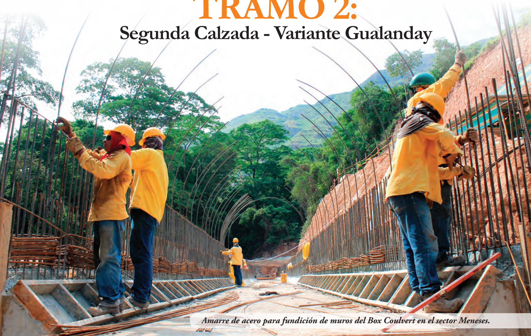
Amarre de acero para fundición de muros del Box Culvert en el sector Meneses.