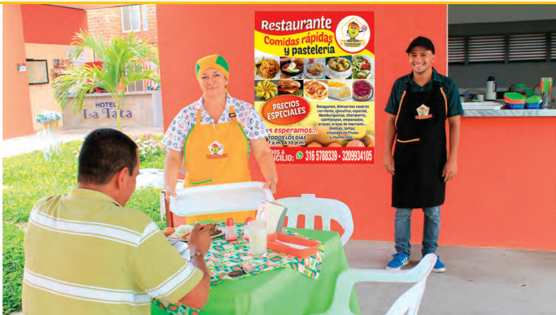
▲ Los locales cuentan con material publicitario donado por Concesionaria San Rafael S.A.

“Estoy muy agradecida con Concesionaria San Rafael S.A. porque me ha brindado apoyo desde que hice el curso de pastelería, luego me colaboraron para participar en el primer Festival del Mango, que se hizo en el Parque Murillo Toro, de Ibagué y en la Feria Tolima SÍ Emprende, que se realizó en el coliseo Enrique Low Murtra, del Sena, en Ibagué”.