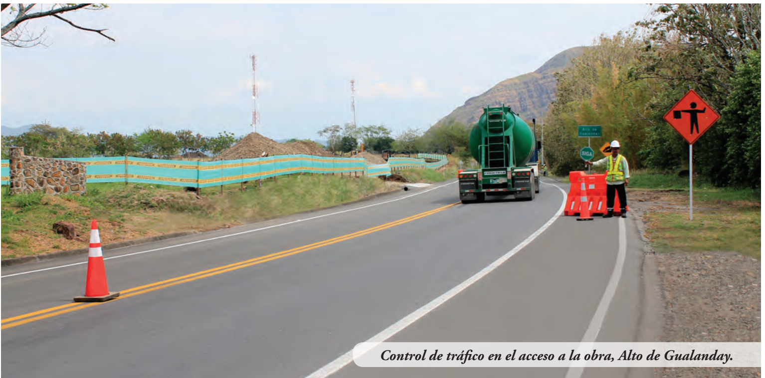
Control de tráfico en el acceso a la obra, Alto de Gualanday.