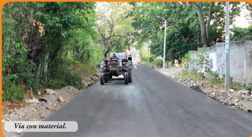
Vía con material.

Con el ánimo de contribuir al mejoramiento de las vías de acceso, esta Firma donó material fre-sado en la Vereda Buenos Aires, de Ibagué y en el ingreso a la subestación del Cuerpo de Bomberos Voluntarios de El Espinal, ubicada en el corregimiento Chicoral.