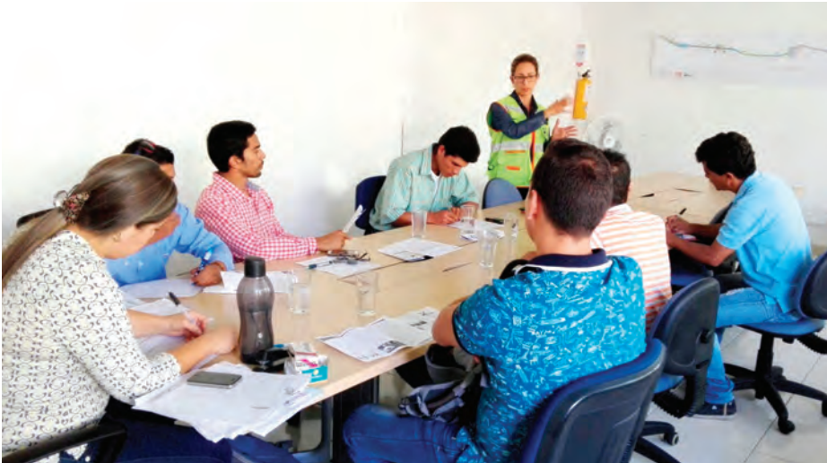
▲ Proceso de capacitación en generalidades del Proyecto.

El nuevo personal que ingresa a Concesionaria San Rafael S.A. y contratistas participa en jornadas de capacitación, en las que el área de Gestión Social, divulga de forma efectiva la naturaleza, alcance y beneficios del Proyecto Vial Girardot – Ibagué – Cajamarca, incluida la Segunda Calzada, Variante Gualanday, Tramo 2, que en la actualidad está en proceso constructivo.