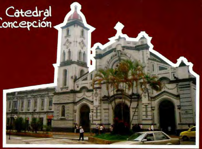
Catedral Inmaculada Concepción