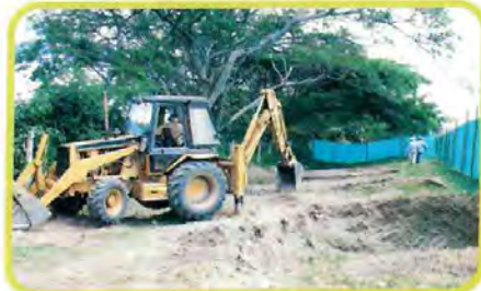
En vereda Puerta Blanca se construirán 2 Puentes, Uno en la Calzada izquierda y otro en la Calzada Derecha.

Por otro lado la construcción del Túnel y Viaducto de Gualanday avanza rápidamente