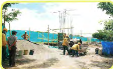
Variante Chicoral - Vereda Potrerillo