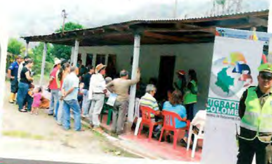
Tramo 5 Vereda El Tostado (Cajamarca)