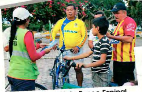
Tramo 1 Ciclo Paseo Espinal