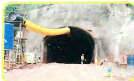
La fase de excavación que se lleva a cabo en el túnel sigue avanzando según lo previsto.