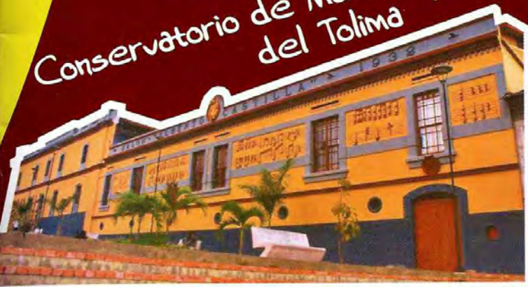
Conservatorio de Música del Tolima

Símbolo de Ibagué. En su interior se encuentra la sala Alberto Castilla, su estilo republicano, templo de música y Monumento Nacional de Arquitectura. Se encuentra ubicado en la Cra 1 entre calles 9 y 10.