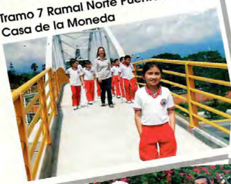
Tramo 7 Ramal Norte Puente Peatonal Casa de la Moneda