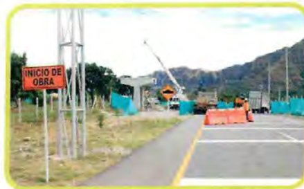
Ramal conectante Estación De Servicio – Las Avispas en Gualanday