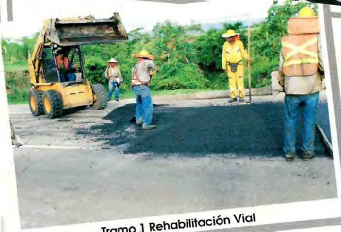
Tramo 1 Rehabilitación Vial