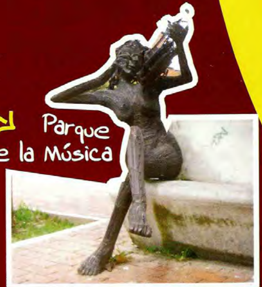
Parque de la Música

Escenario cultural, artístico y folclórico; puerta de entrada del Cañón del Combeima. Ubicado en la cra 1 con calle 10