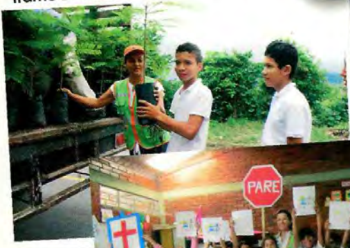
Tramo 2 Vereda Chaguala Afuera