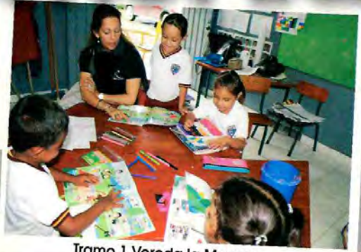
Tramo 1 Vereda la Morena