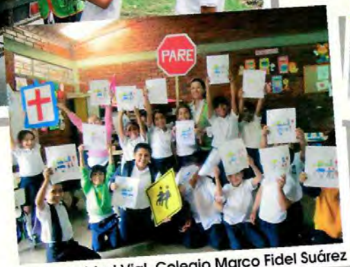
Taller Seguridad Vial, Colegio Marco Fidel Suárez