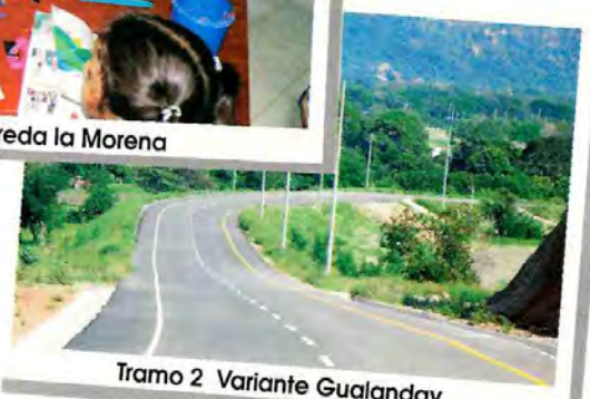
Tramo 2 Variante Gualanday