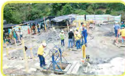
La excavación de los Caisón sigue adelante para dar paso al proceso de cimentación.

Por otro lado la construcción del Túnel y Viaducto de Gualanday avanza rápidamente