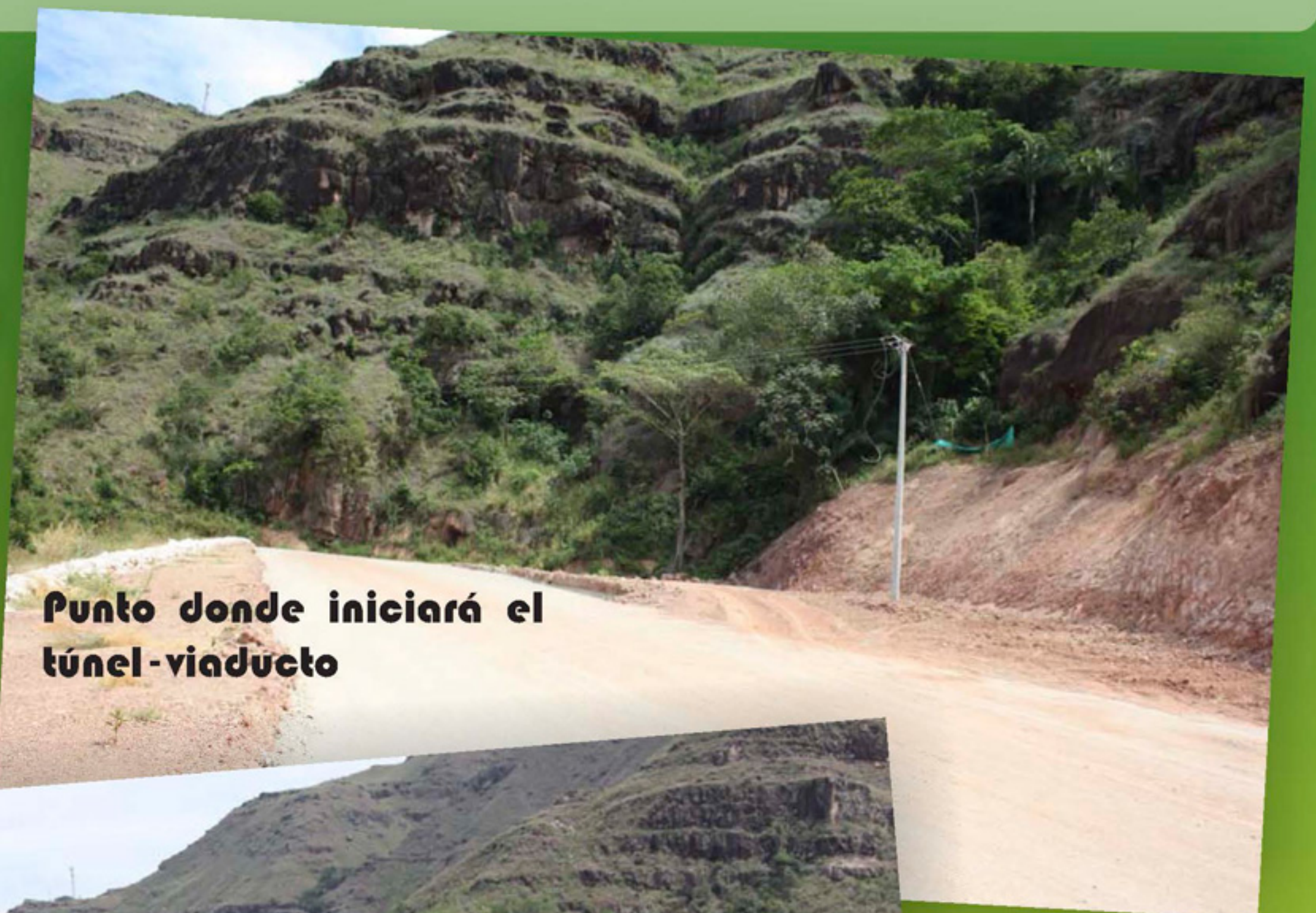
Punto donde iniciará el túnel-viaducto