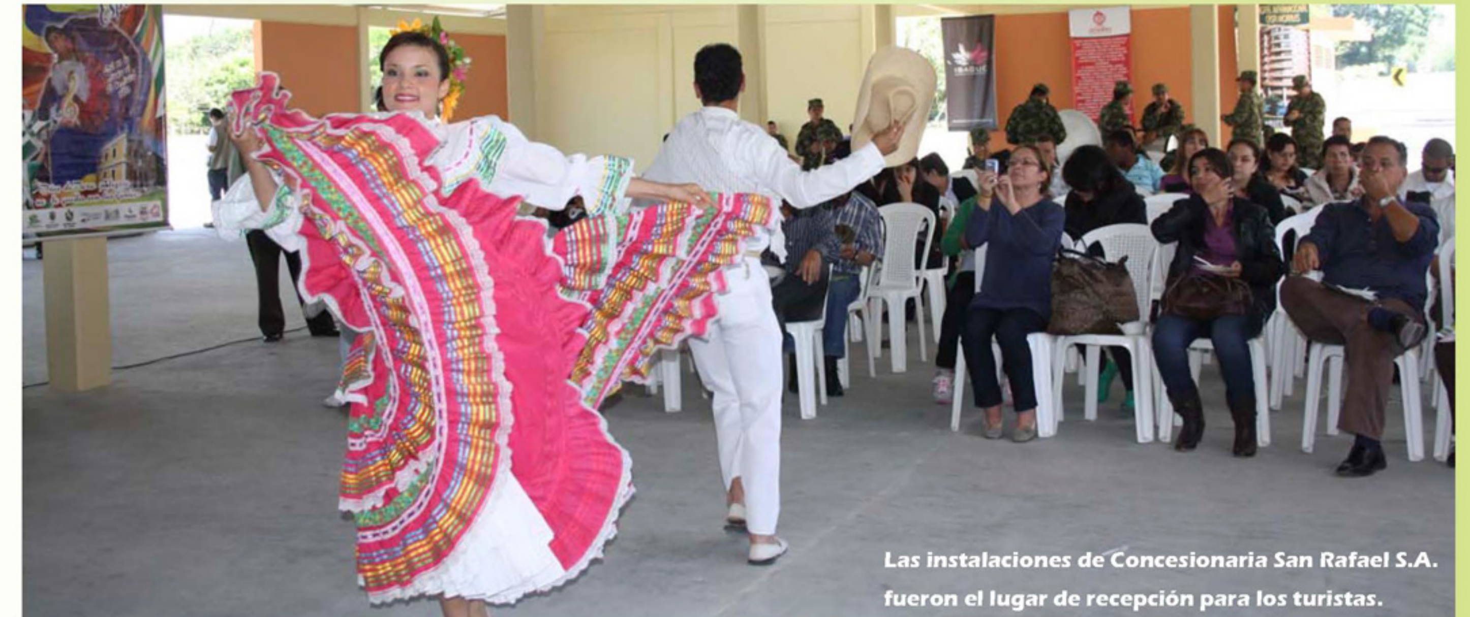
Las instalaciones de Concesionaria San Rafael S.A. fueron el lugar de recepción para los turistas.

Con la tradicional lechona, el típico tamal tolimense y las danzas folclóricas de la ciudad, fueron recibidos los turistas que llegaron a la Capital Musical de Colombia en el preámbulo de las fiestas del San Juan y San Pedro.