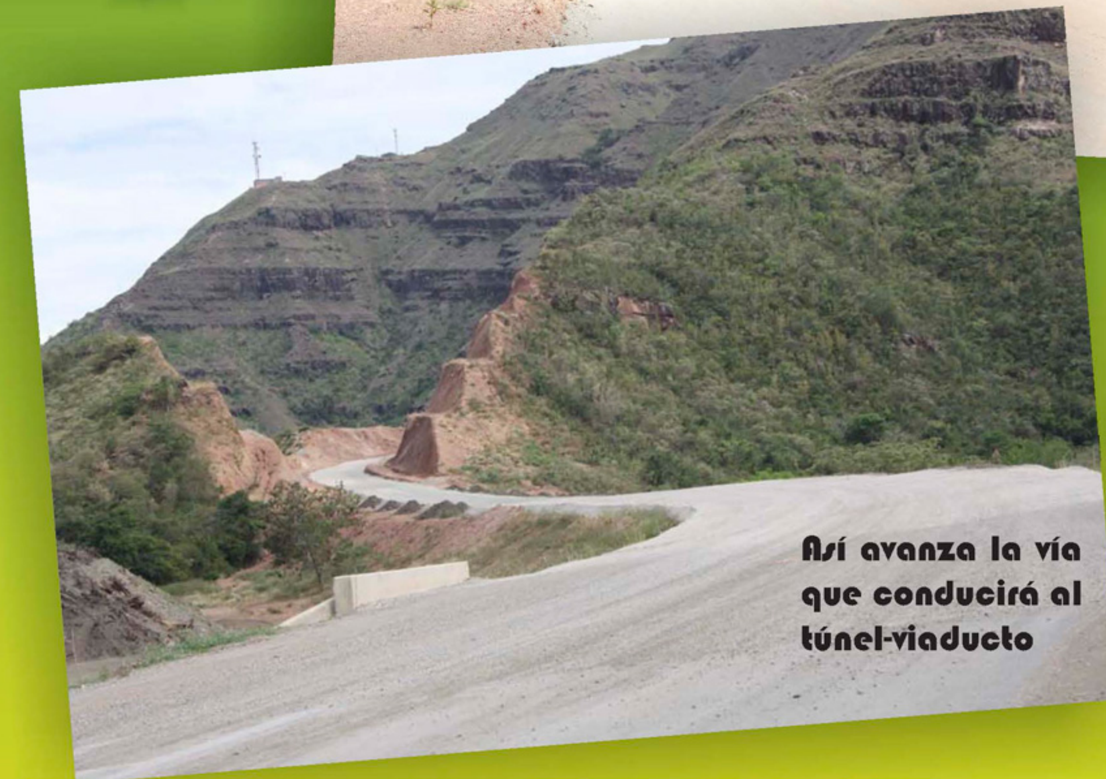
Así avanza la vía que conducirá al túnel-viaducto