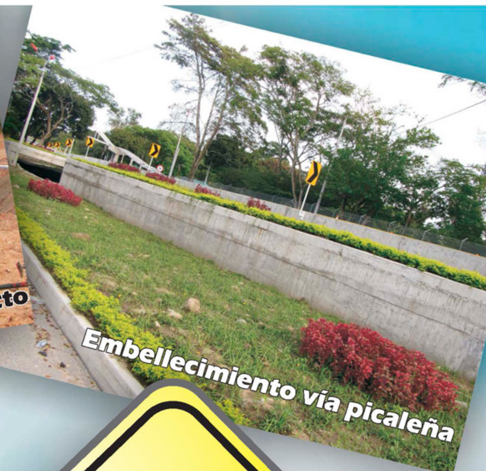
Embelllecimiento vía picalaña