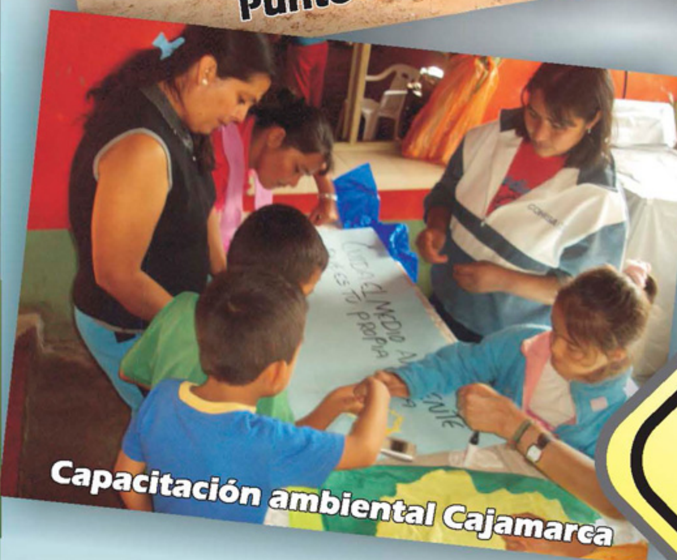
Capacitación ambiental Cajamarca