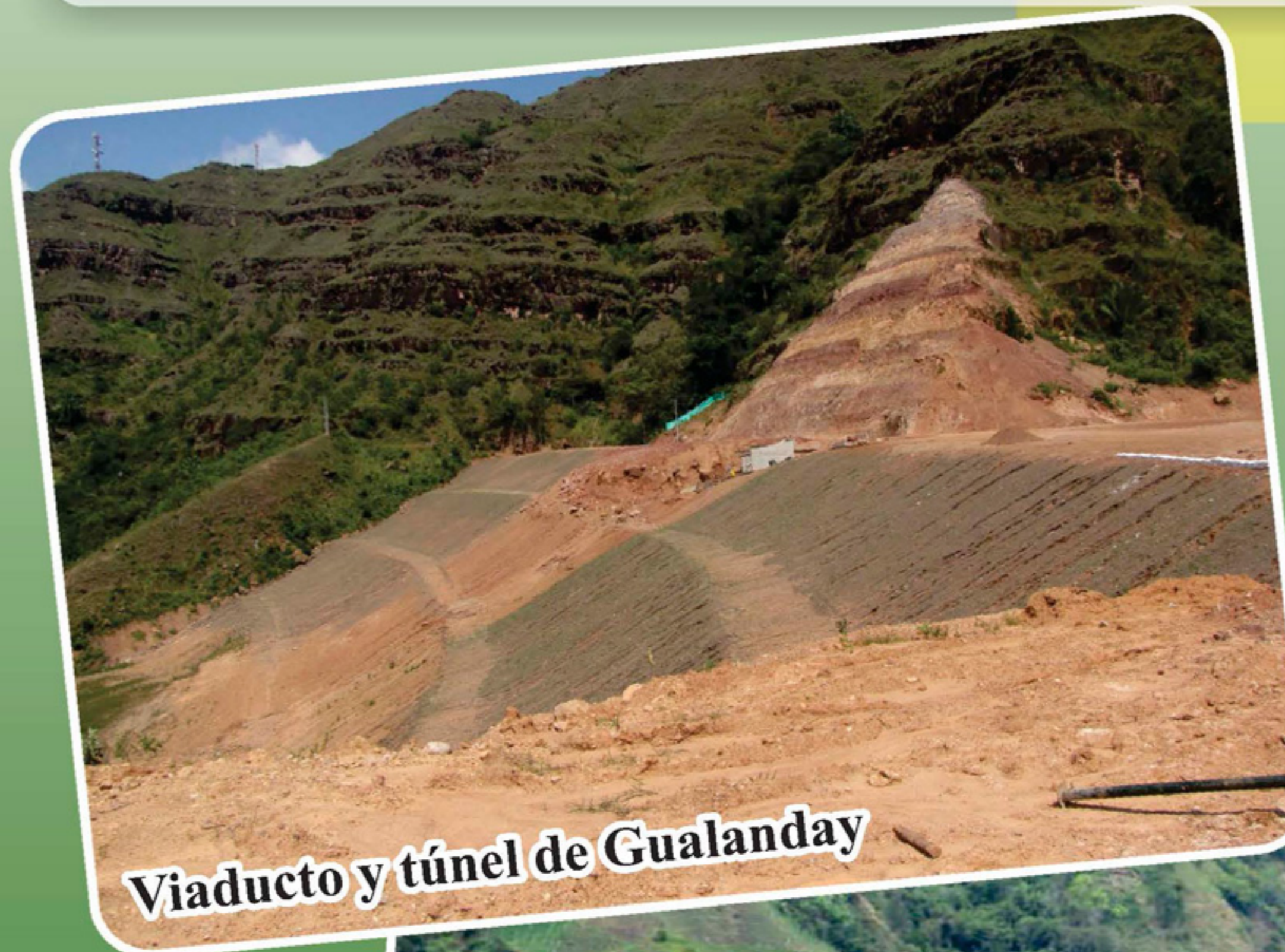
Viaducto y túnel de Gualanday

De los siete tramos que comprende el proyecto, solo falta por terminar el tramo Dos: Construcción del viaducto y el túnel de Gualanday que se comenzó a ejecutar desde mayo del 2011. Actualmente se sigue a la espera de la licencia por parte del Ministerio de Medio Ambiente y Desarrollo Sostenible para perforar la montaña. Esta comprende un kilómetro para el túnel y las rampas de entrada y salida del otro lado del puente, que tendrá las medidas de 0.7 kilómetros de distancia por 100 metros de altura, y que se erigirá sobre la quebrada Gualanday.