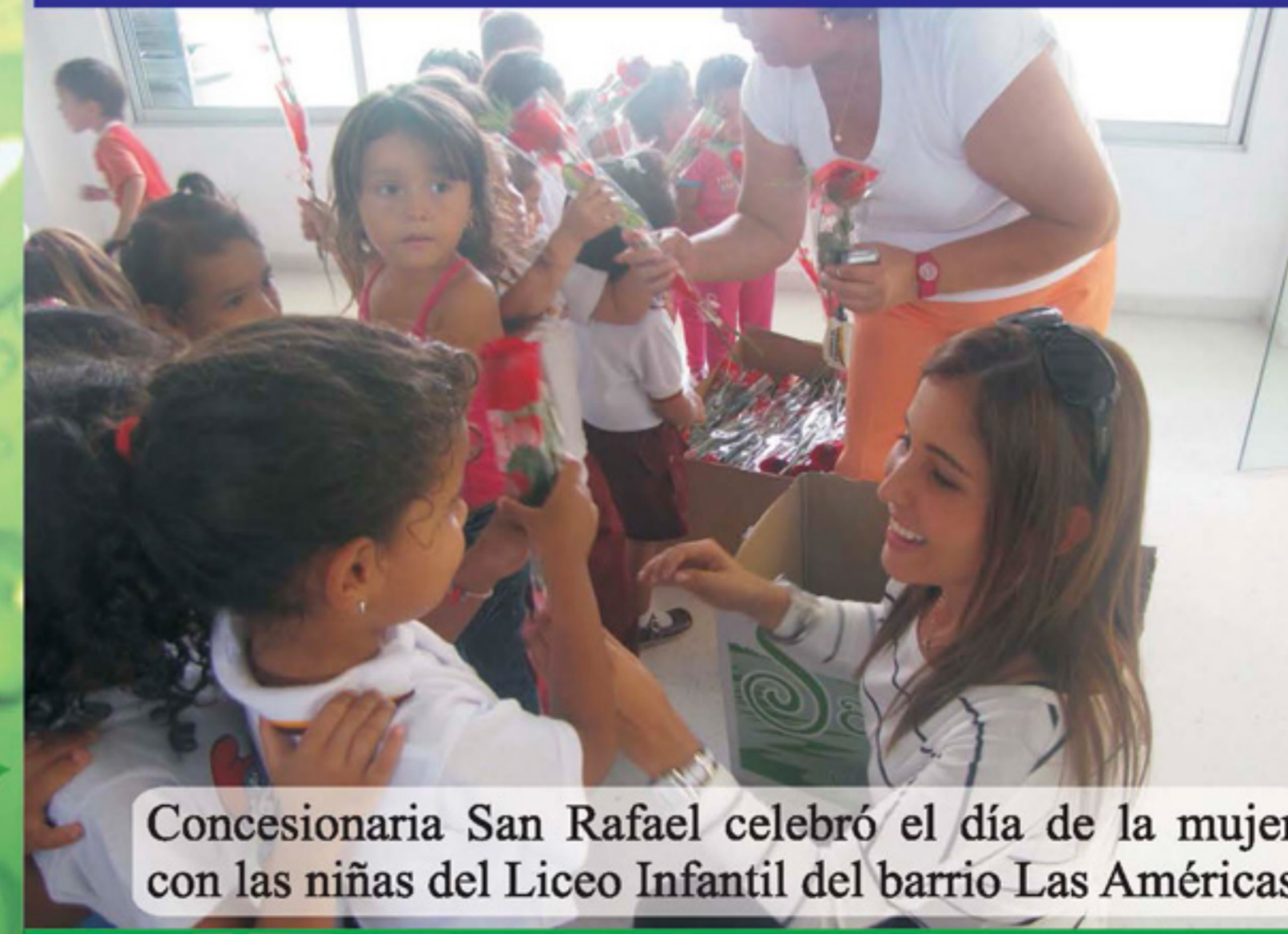
Concesionaria San Rafael celebró el día de la mujer con las niñas del Liceo Infantil del barrio Las Américas

Concesionaria San Rafael S.A. capacitó a 150 personas del municipio de Cajamarca en cuidado del medio ambiente. Esto se realizó mediante siete capacitaciones que vinculó a personas de todas las edades.