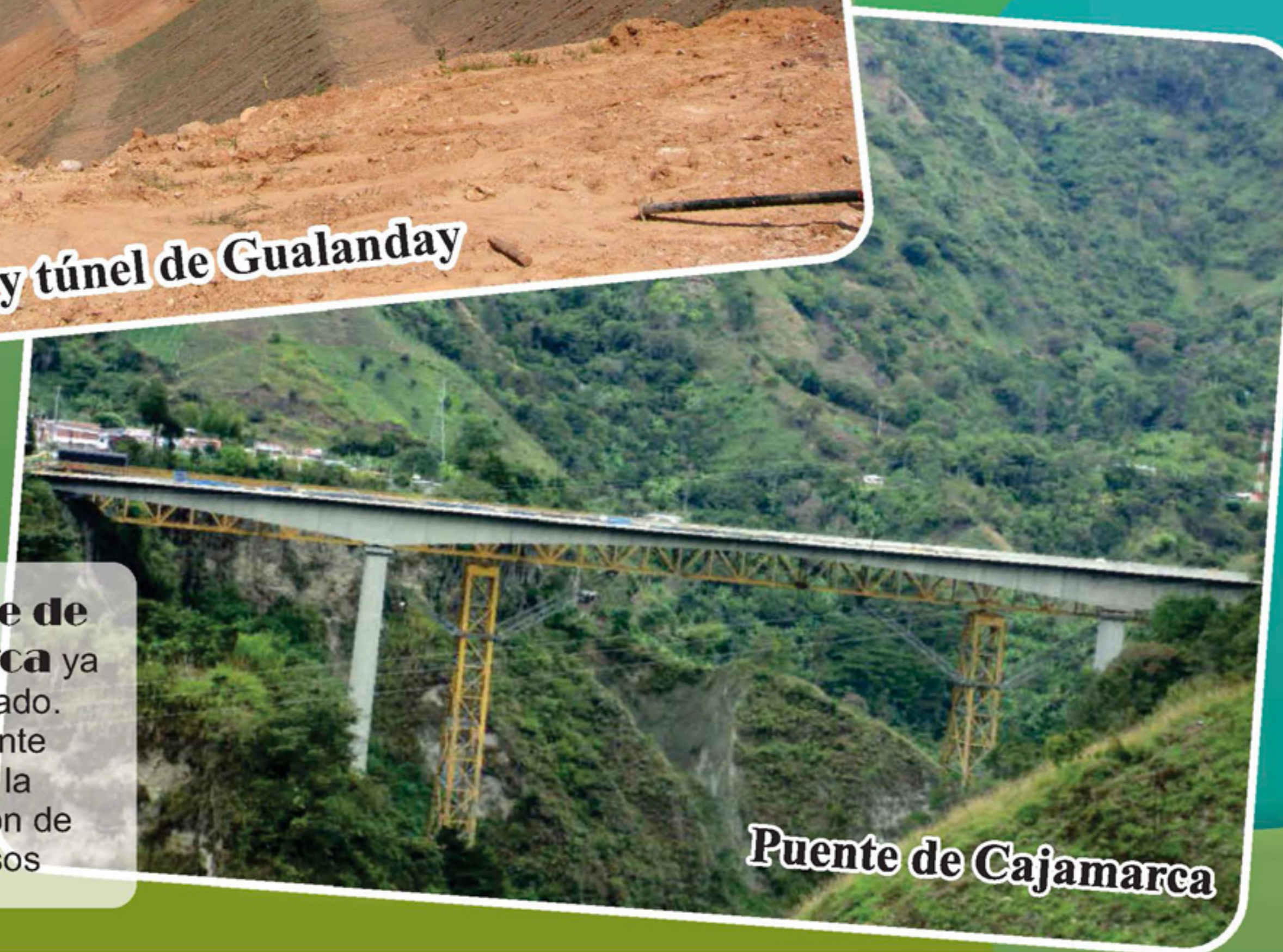
Puente de Cajamarca

El puente de Cajamarca ya fue terminado. Actualmente finalizan la construcción de los accesos