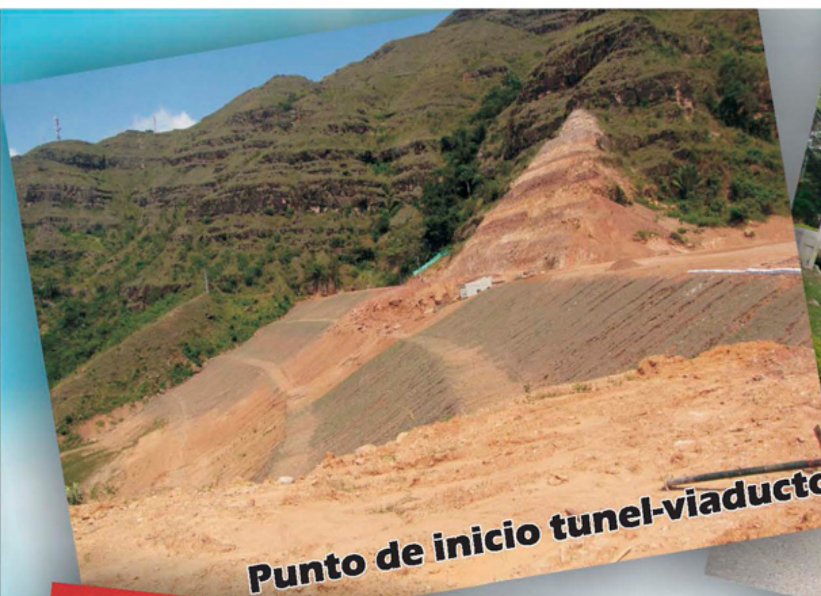
Punto de inicio tunel-viaducto