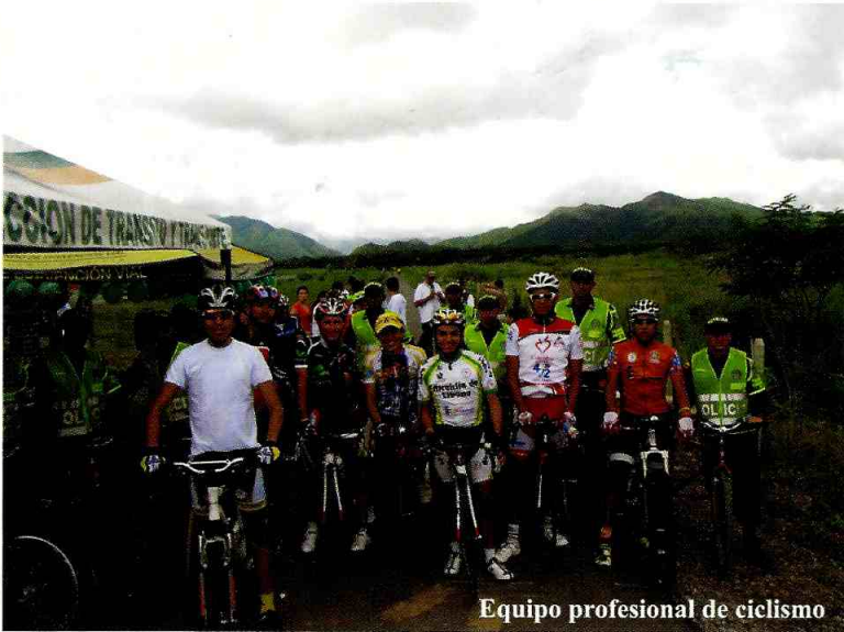
Equipo profesional de ciclismo