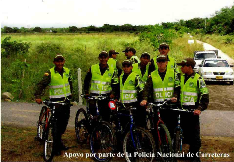
Apoyo por parte de la Policía Nacional de Carreteras