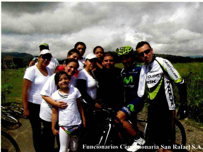
Funcionarios Compañía San Rafael S.A.

La cicloruta fue inaugurada el año pasado con la presencia del Presidente de la República de Colombia, Dr. Juan Manuel Santos Calderón. Desde esa fecha los tolimenses han disfrutado de 17 kilómetros totalmente seguros y rodeados de un paisaje multicolor.