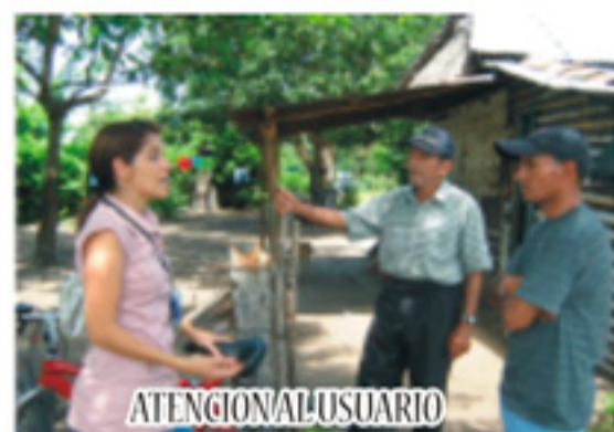
ATENCIÓN AL USUARIO

Los programas a desarrollar del proyecto Girardot-Ibagué- Cajamarca son los siguientes: