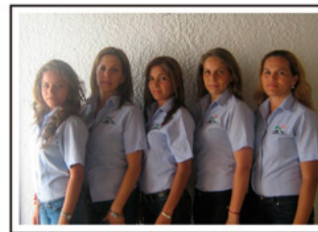
GRUPO DE GESTIÓN SOCIAL

Este programa fue diseñado especialmente para obtener el conocimiento detallado de las actividades que se desarrollan en la zona aledaña a la vía. De igual forma, busca construir relaciones sociales y de cooperación entre la Concesionaria y los vecinos, en donde todos los actores responsables de los procesos participen de forma activa y de esta manera, tener toda la información sobre las prácticas productivas y sociales, los planes de desarrollo y ordenamiento municipal, la oferta local y regional de apoyo a la solución de problemas.